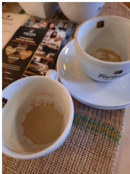
Abbildung 1: Lupine im Kaffee? Schmeckt!

Schon mit der Begrüßung wird klar: Hier findet ein lebendiger Austausch auf Augenhöhe statt. Alle Teilnehmenden stellen sich beim Lupinenkaffee zunächst in der Runde vor. Vom Biolandbetrieb bis hin zu passionierten Kaffeeliebhabern: Die Lupine verbindet sie alle, wenn auch aus ganz unterschiedlichen Perspektiven.