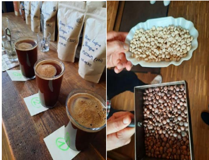
Abbildung 2: Rohware und geröstete Lupinen im Vergleich (rechts), Lupinenkaffee vor dem Verkosten (links)

Der Höhepunkt des Tages ist das gemeinsame Verkosten, in der Fachsprache auch Cupping genannt. Nach international standardisiertem Verfahren werden verschiedene Lupinenkaffees systematisch verkostet. Die beiden Sorten Boregine und Frieda wurden in drei unterschiedlichen Röstgraden getestet, ergänzt durch eine Lupinen-Kaffee-Mischung von Fortezza (ein Drittel Kaffee, zwei Drittel Lupine) und von Eduscho (50 % Kaffee, 50 % Lupine).