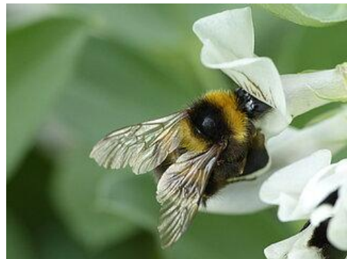
Hummel an einer Ackerbohnenblüte

Der Anteil der verschiedenen Befruchtungswege variiert je nach Sorte, Umweltbedingungen, dem Fremdbefruchtungsanteil der vorherigen Generation sowie dem Stressniveau der Pflanzen.