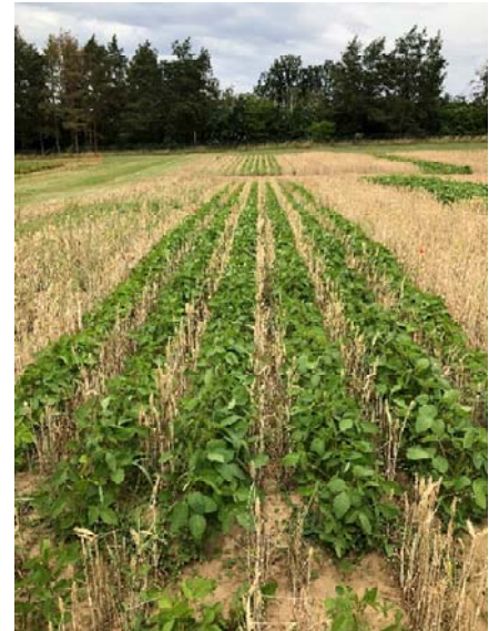
Beim sogenannten Relay Intercropping, oder auch Staffelnkultur, werden Hülsenfrüchte und Getreide zeitversetzt ineinander angebaut.

Zum Abschluss der Veranstaltung konnten die Teilnehmenden die Wertschöpfungskette auch kulinarisch erleben. Neben einer leckeren Brotzeit aus regionalen Backwaren und Aufstrichen, wie Hummus und Kürbisaufstrich mit Schwarzkümmel verkosteten sie auch regionale Kichererbsen und Bohnen. Zubereitet wurde das pflanzenbasierte, regionale Bio-Mittagessen von dem Eberswalder Feinkostanbieter Kochkommode. Die Kichererbsen stammten beispielsweise aus einem gemeinsamen Partnerbetrieb von KIWERTa und LeguNet.