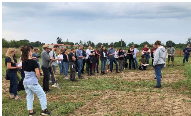
Das Interesse an der Führung über die Versuchsflächen fand regen Anklang.

Zum Feldtag eingeladen hatten das ZALF, das Kichererbsen-Projekt KIWERTa, die Regionalwert AG und das Leguminosen-Netzwerk LeguNet. Im Fokus standen ganz praktische Fragen von Landwirtinnen und Landwirten rund um den Anbau von Hülsenfrüchten. Um die 40 Teilnehmende, darunter Landwirtinnen und Landwirte aus der Region, Forschende, sowie Beraterinnen und Berater nutzten die Gelegenheit, sich über Best-Practice-Beispiele für den Anbau von Hülsenfrüchten auszutauschen und sich zu vernetzen.