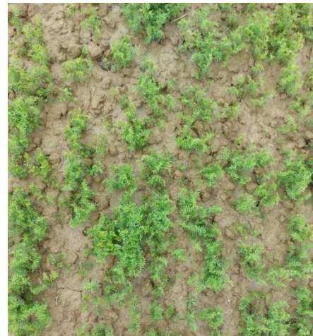
Linsen in Reinsaat, der hohe Tonanteil des Bodens ins deutlich erkennbar.