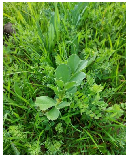
Ausfall Ackerbohnen und Kichererbsen im verunkrauteten Linse-Einkorn-Gemenge

Normalerweise werden die Leguminosen in der Region im Frühjahr gesät. Die Erträge sind durch den Wassermangel oftmals gering. Saras Anpassungsstrategie: Eine Aussaat im Oktober. So nehmen die Leguminosen die Winterfeuchte mit. Eine Beikrautregulierung nach der Saat ist durch die einsetzenden Niederschläge und die schweren Böden allerdings kaum möglich. Die Gefahr der Auswinterung existiert auch hier. „Dieser Winter war besonders hart, mit einer Woche mit Tiefsttemperaturen nachts von -7/-8^{\circ}\text{C} “, erzählt Sara. „Normalerweise wird es im Winter nicht viel kälter als 0^{\circ}\text{C} “. Trotz der kalten Temperaturen bei gleichzeitiger Nässe haben Kichererbsen und Linsen den Winter allerdings gut überstanden. Ich bin zudem überrascht, wie gesund die Leguminosen aus dem Winter kommen: Nach Botrytis muss man selbst bei Ausfallbohnen