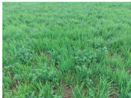
Direktsaat von Weizen in einen oberflächlich bearbeiteten Luzernebestand.